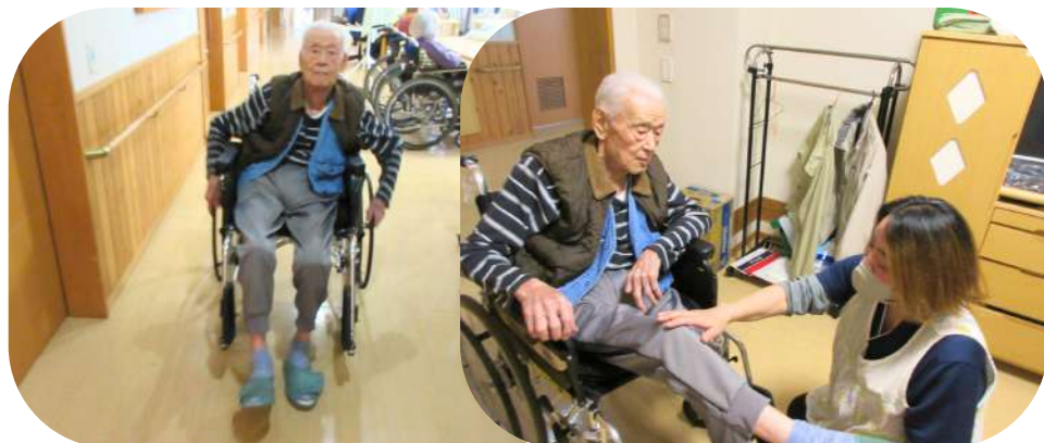
車椅子足漕ぎ訓練の様子

利用者の皆様の生活動作も機能訓練の一環として捉え、具体的に、車椅子足漕ぎ訓練、立位訓練等を行っています。