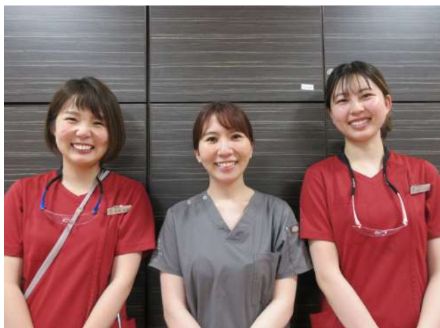
山下先生と歯科衛生士の皆様